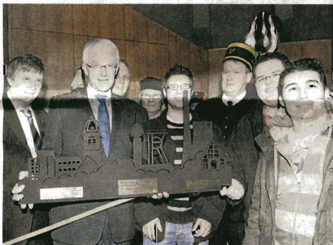
Auszubildende der RAG Anthrazit Ibbenbüren GmbH hatten ein Geschenk für den Ministerpräsidenten.