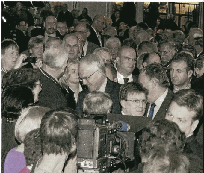
Jürgen Rüttgers genoss das Bad in der Menge.