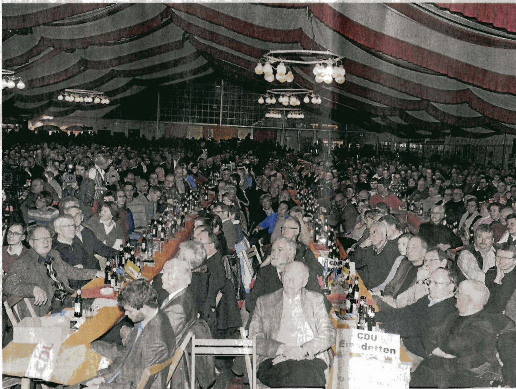
Mehr als 2000 Menschen waren ins Festzelt nach Recke gekommen. Sie spendeten den Rednern begeistert Beifall. Dr. Jürgen Rüttgers wurde vom Publikum gefeiert.